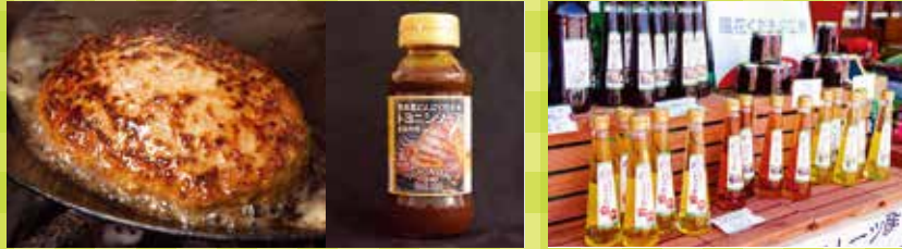
12 トヨニシファーム・赤身肉用特製トヨニソース ・豊西牛100%ハンバーグ(冷凍)など加工品 13 風花くだもの工房 ・くだもの酢・ジャム