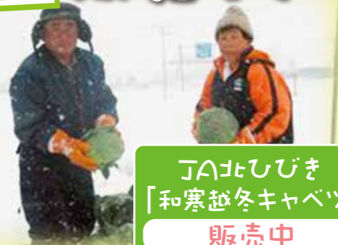
JANA北ひびき 「和寒越冬キャベツ」 販売中