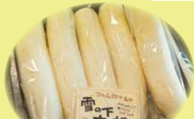
JANA函館市亀田 「雪の下大根」 販売中