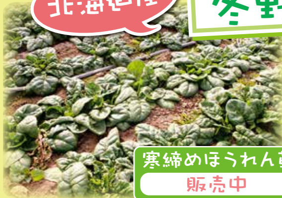
寒締めほうれん草 販売中