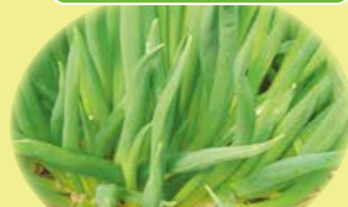
JANAピッポ町千本ねぎ 「旬の彩り。」 1月中旬ごろ～